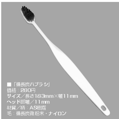
■「備長炭ハブラシ」 価格：280円 サイズ/長さ183mm×幅11mm ヘッド部幅/11mm 材質/柄：ASA樹脂 毛：備長炭微粉末・ナイロン

ハブラシのブラシ部分が、黒色のまな板と変わらない。しゃもじやまな板と同じように「白」の部分が大きい(歯磨き粉をハブラシにつけてもこの部分につけたが、白のブラシだと分かりにくい)。この備長炭ハブラシは、歯磨き粉のついた部分がはつきり分かるだけでなく、備長炭の消臭効果も期待できる。