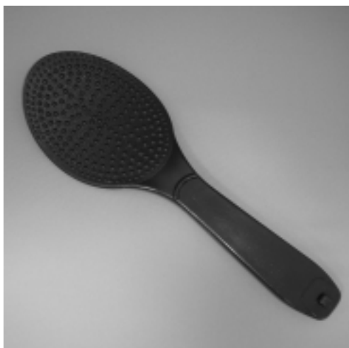
■「ご飯くつきり」竹炭しゃもじ：価格：380円 原材料/ポリプロピレン・竹炭粉末 耐熱温度/140度 耐冷温度/-20度 長さ/約20cm×幅(しゃもじ部分)約7cm

普段私たちが使っているしゃもじは、木の色をしていたり白色をしていたりするものが多い。見えにくい人達にとっても、白や木の色はあっても、「ご飯粒」のついてくる「ご飯粒」は目立つ。しかし見えにくい人達や弱視の人達にとっては、しゃもじ自体にどのくらいのご飯粒がついているか知ることが難しい。 そんな時に役立つものが「竹炭しゃもじ」だ。 「竹炭しゃもじ」は、本体が黒いため、「ご飯粒」のつき具合がはっきり把握できる。 さらに「竹炭しゃもじ」は、飯粒がつきにくい素材で、表面に特殊な突起をつけているので、「ご飯粒」のつきを事前に防止してくれるのも助かる。 竹炭の持つ消臭作用が「飯」の美味しさを長持ちさせるだけでなく、